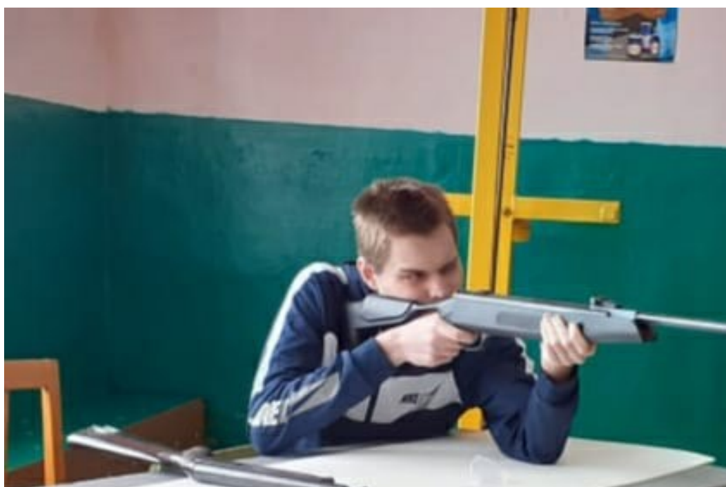
Пулевая стрельба из пневматической винтовки.